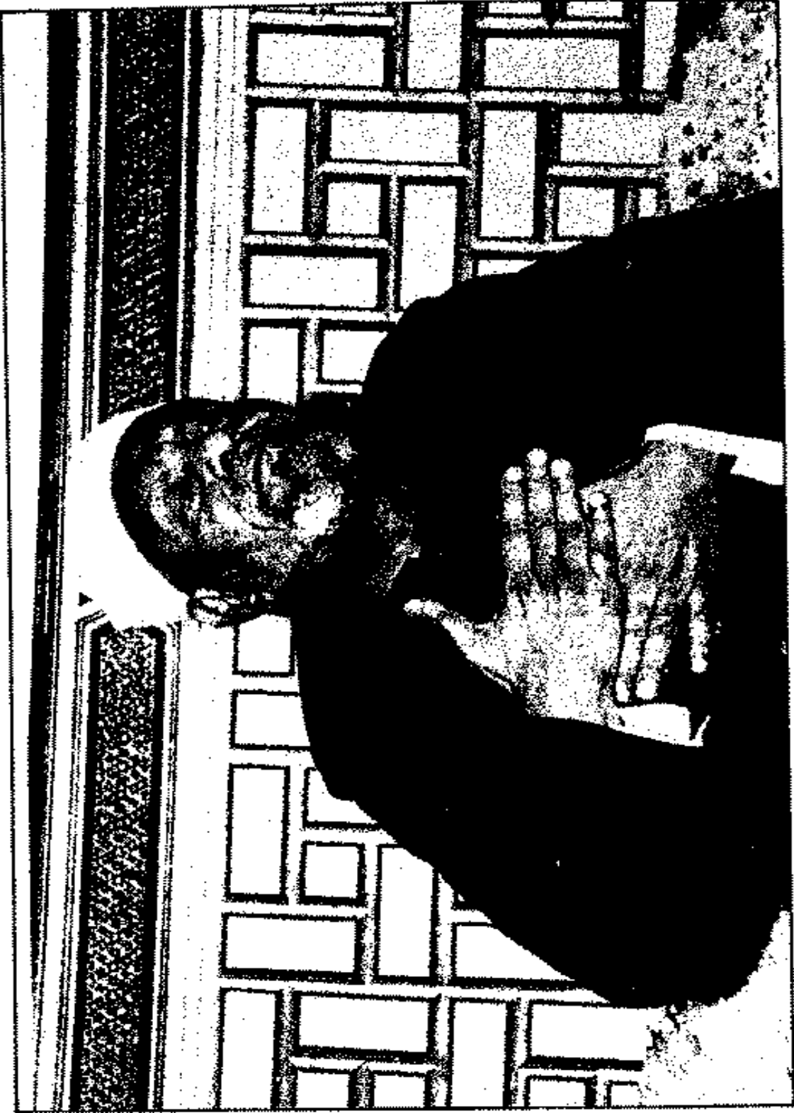
ليلة القدر سميت كذلك لأنها الطرب والعظمة والمكانة العالية