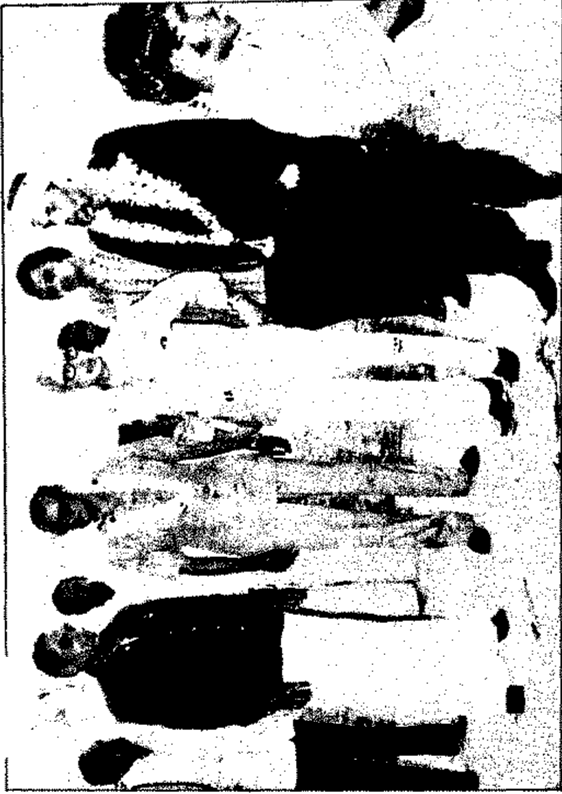
الشيخ الشعراوي أثناء تكريمه في الهند