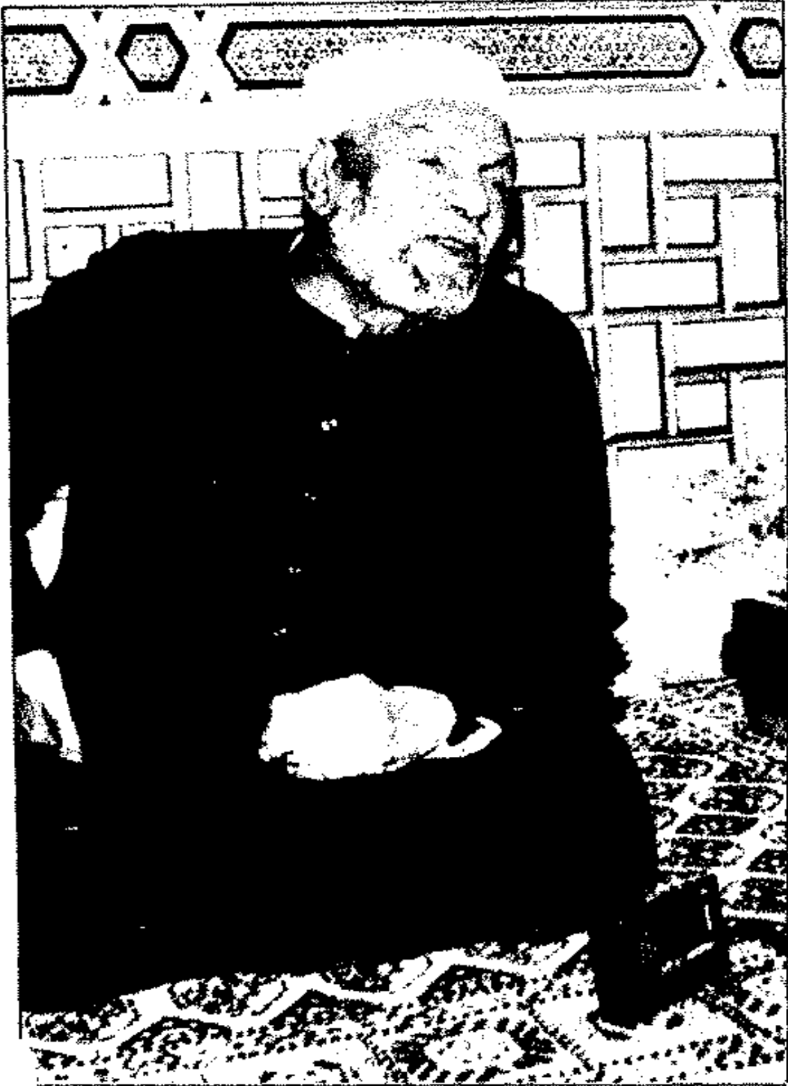
هو ساعة ما تقوم الساعة .. حد حبيبي له كلام